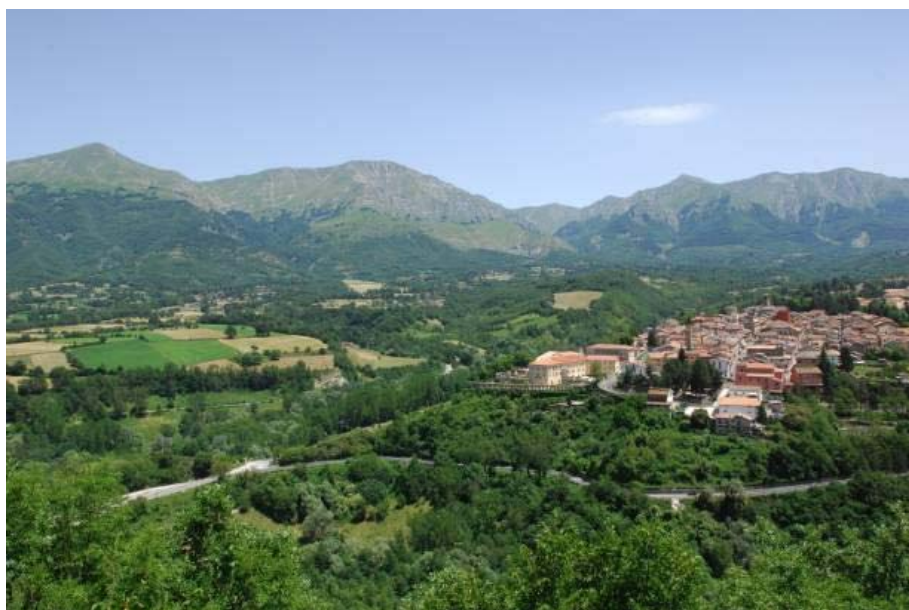
Veduta di Amatrice

Per festeggiare i 150 anni del Club Alpino Italiano, dieci sezioni e sottosezioni CAI di Abruzzo, Lazio, Marche ed Umbria – Amatrice, Antrodoco, Ascoli Piceno, L'Aquila, Leonessa (sottosez. Rieti), Monterotondo (sottosez. Tivoli), Rieti, Roma, San Benedetto del Tronto e Spoleto – hanno definito il progetto denominato "CAI 150 Salaria - Quattro regioni senza confini" mirato alla valorizzazione della fascia appenninica intorno all'antica via Salaria e al più longevo confine di stato preunitario. L'avvio è previsto già nel 2012 con un programma di escursioni congiunte organizzate da ciascuna sezione su percorsi paralleli e trasversali alla Salaria e la Sezione di Ascoli Piceno ha il compito di organizzare la prima escursione. L'epilogo avverrà nel 2013 con la percorrenza di due grandi itinerari escursionistici dall'Adriatico al Tirreno e da Spoleto a L'Aquila e con la presentazione della guida escursionistica della Salaria comprendente itinerari sia a piedi che in mountain bike.